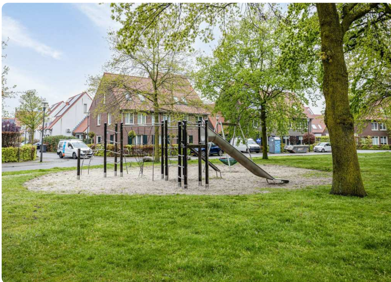
Besselhoeve 28, te Helmond