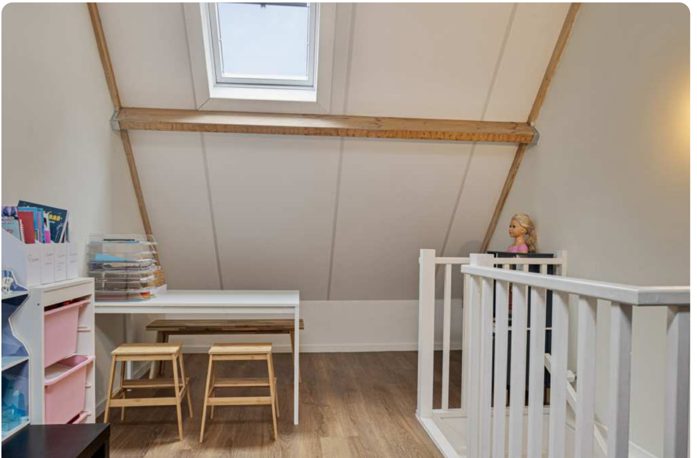
Hobby-/werk-/slaapkamer boven garage