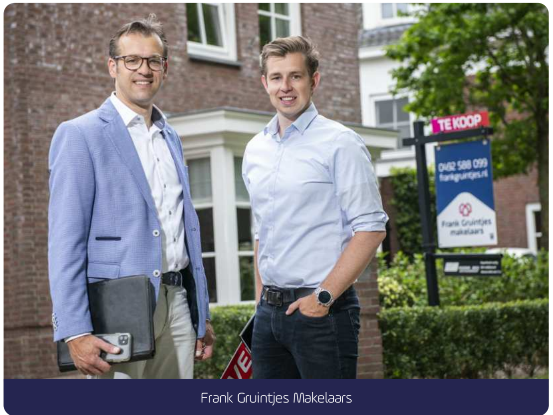
Frank Gruintjes Makelaars